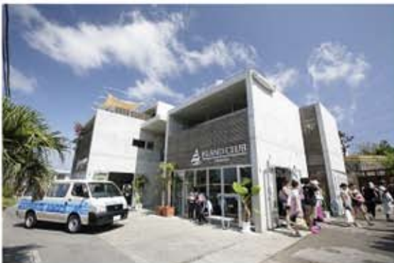
企業外観(店舗の外観です)